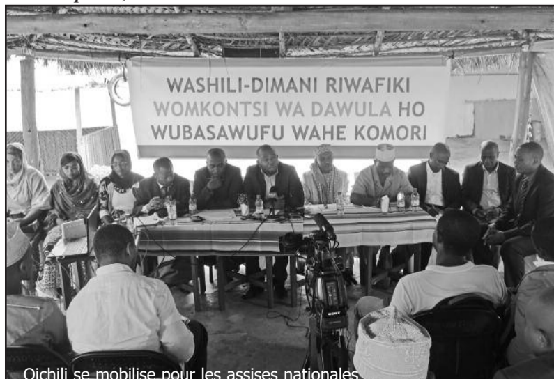
Oichili se mobilise pour les assises nationales

tenue de ce dialogue national qui divise l'opinion. Des tournées de sensibilisation sont prévues dans la région.