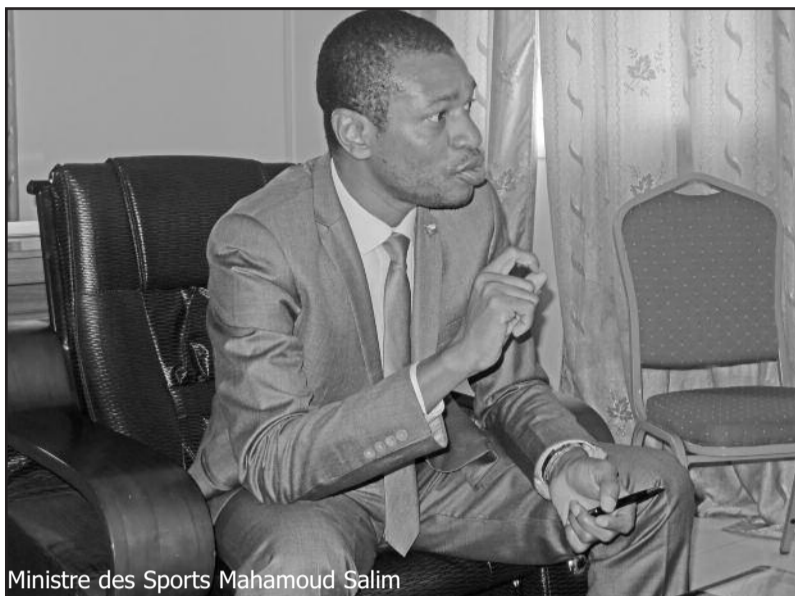
Ministre des Sports Mahamoud Salim

Devant la presse le mardi 05 décembre 2017 à Moroni, le Ministre des Sports, Mahmoud Salim Hafî, confirme son projet cher d'innover dans les diverses compétitions nationales, après assainissement. La formule actuelle est jugée défailante, et pire, source des scandales. Le championnat des Comores, avec les trente équipes de D1 opérationnelles (Moili 8, Ndzouani 10 et Ngazidja 10) serait uniformisé et harmonisé par une seule Ligue alors.