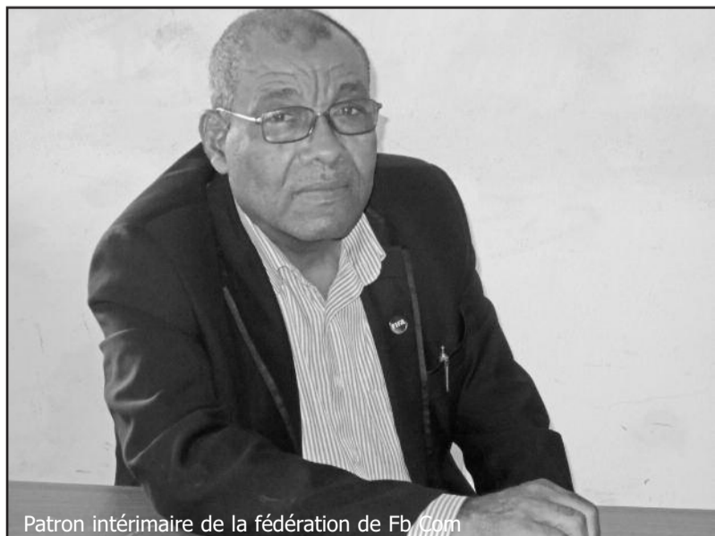
Patron intérimaire de la fédération de Fb Com

La compétence des techniciens de la haute instance du football national, le talent des arbitres et le fair-play des équipes et du public ont permis de conduire la compétition à bon