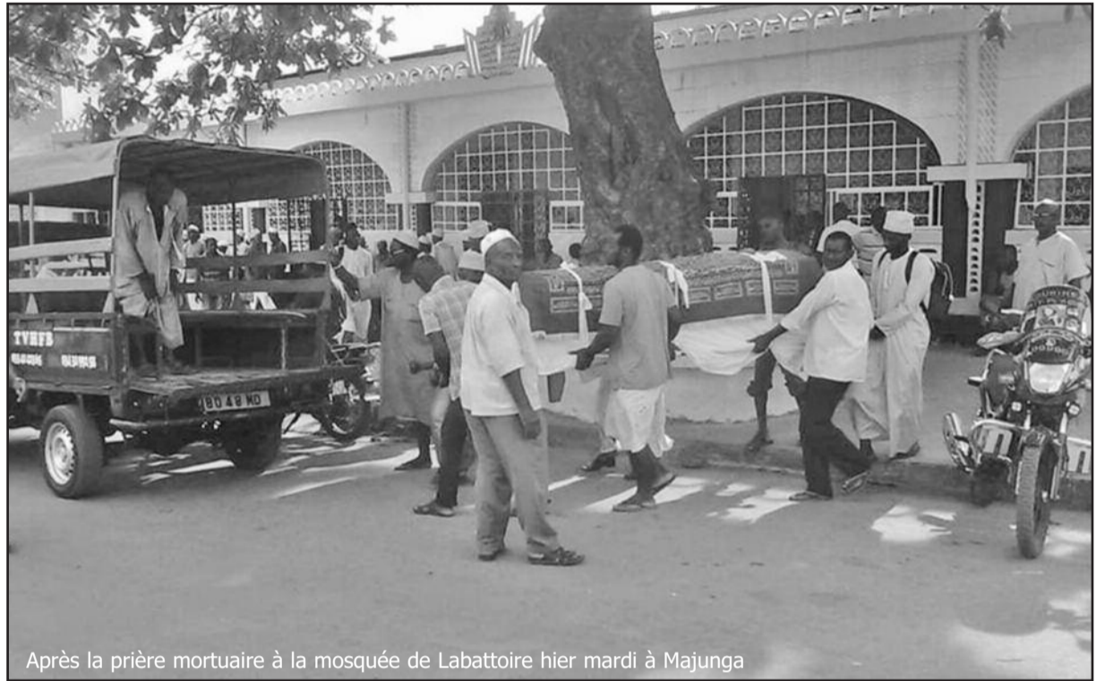
Après la prière mortuaire à la mosquée de Labattoire hier mardi à Majunga