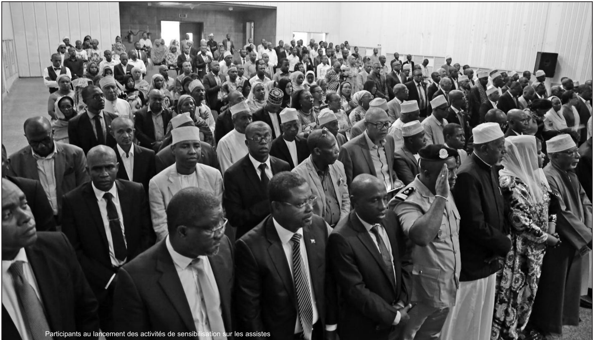
Participants au lancement des activités de sensibilisation sur les assistés

MINI-RETRAITE DU SYSTÈME DES NATIONS-UNIES