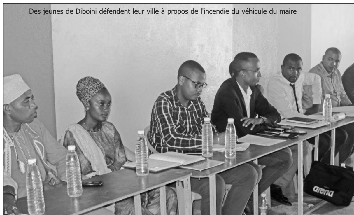
Des jeunes de Diboïni défendent leur ville à propos de l'incendie du véhicule du maire

A Diboïni en Grande Comore, plus de 60 personnes dont des mineurs ont été arrêtées. Cela fait suite à l'incendie de la voiture du maire de la commune de Hamavou, survenue à Diboïni. Les responsables du village dénoncent des arrestations arbitraires. Dans une conférence de presse, leur avocat Me Baco, parle de procédures entachées d'irrégularités.