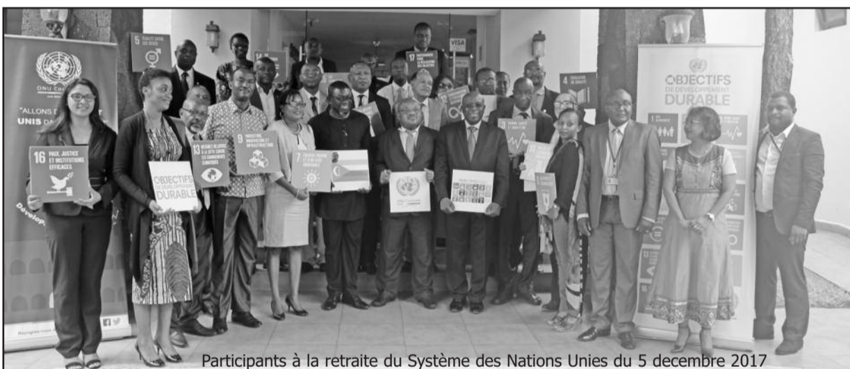
Participants à la retraite du Système des Nations Unies du 5 décembre 2017

« Une démarche qu'épouse parfaitement le gouvernement comorien déterminé à collaborer avec vous et avec tous ses partenaires pour l'atteinte des résultats escomptés de part et d'autre » a-t-il dit, saluant au passage le travail des agences onusiennes résolument engagées à œuvrer en vue d'un développement durable dans son